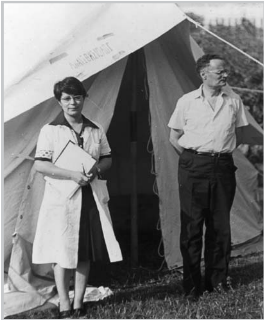
Έξω από τη σκηνή χειρουργείου στον περίβολο του Νοσοκομείου ΑΧΕΠΑ