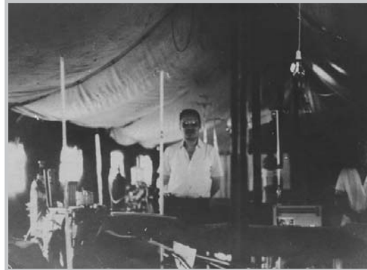
Εντός της σκηνής χειρουργείου δίπλα στον αναισθησιολογικό εξοπλισμό

Στη φωτογραφία ο Καθηγητής Σπ. Γ. Μακρής και η τότε Επιμελήτρια ΑΠΘ και σήμερα Καθηγήτρια Αναισθησιολογίας ΑΠΘ κα Μ.Μ. Γκιάλα.